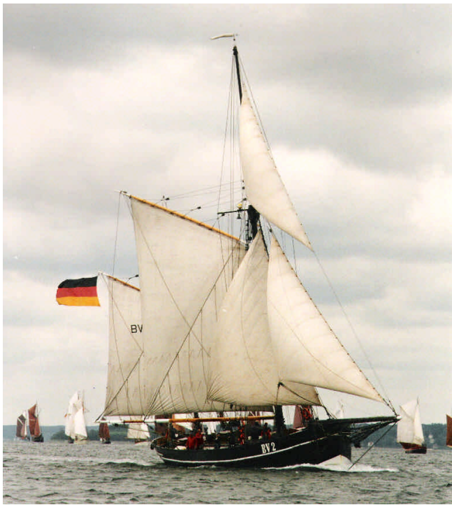
Maritimer Botschafter für Bremen